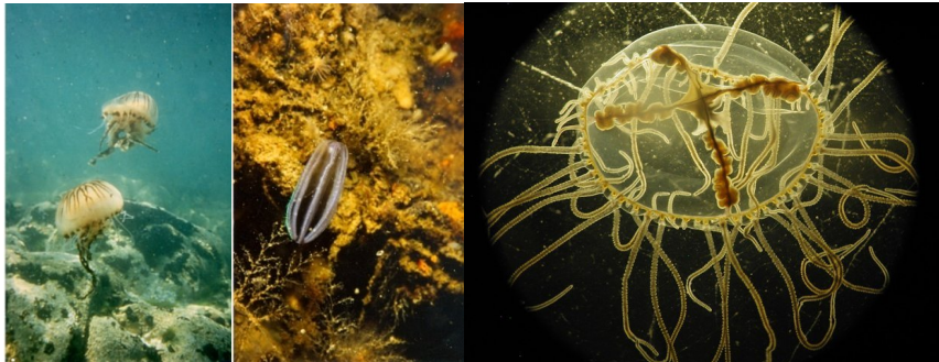
Links een Kompaskwal, midden een Meloenkwal (ribkwal) en rechts een Kruiskwal (vergroting).

De Kruiskwal hoort bij de medusen, een aparte groep.