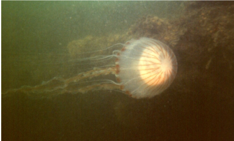
Kompaskwal in de Oosterschelde, een gekleurde kwal met lange tentakels.... niet aanraken dus.

Niet stekende kwallen zijn doorzichtig. Deze kwallen hebben geen lange losse tentakels en hebben weinig tot geen kleur. Een voorbeeld is de Oorkwal, die de laatste tijd veel in het Veerse Meer voorkomt. Deze is te herkennen aan de vier witte rondjes in het midden van de kwal, zie de foto's.